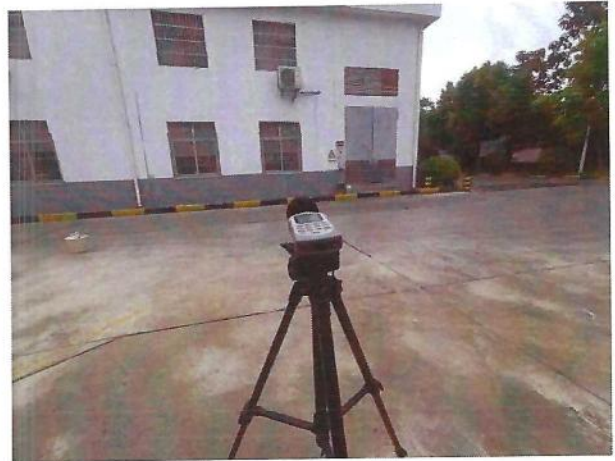
厂界（▲4）噪声监测点位