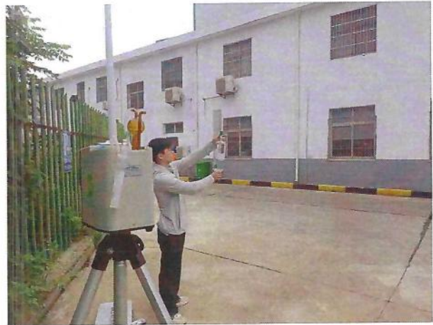
厂界（O2）无组织排放监测点位