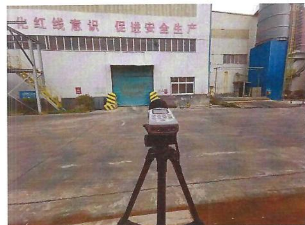
厂界（▲2）噪声监测点位