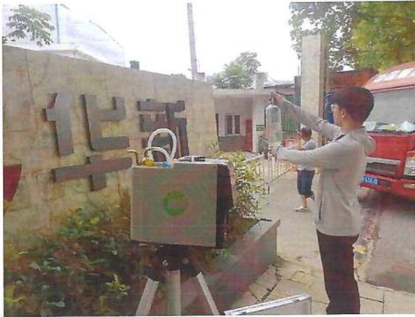
厂界（O1）无组织排放监测点位