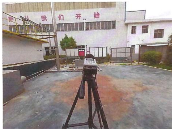
厂界（▲1）噪声监测点位