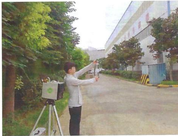
厂界（O3）无组织排放监测点位