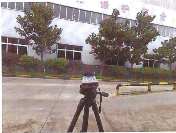
厂界（▲3）噪声监测点位