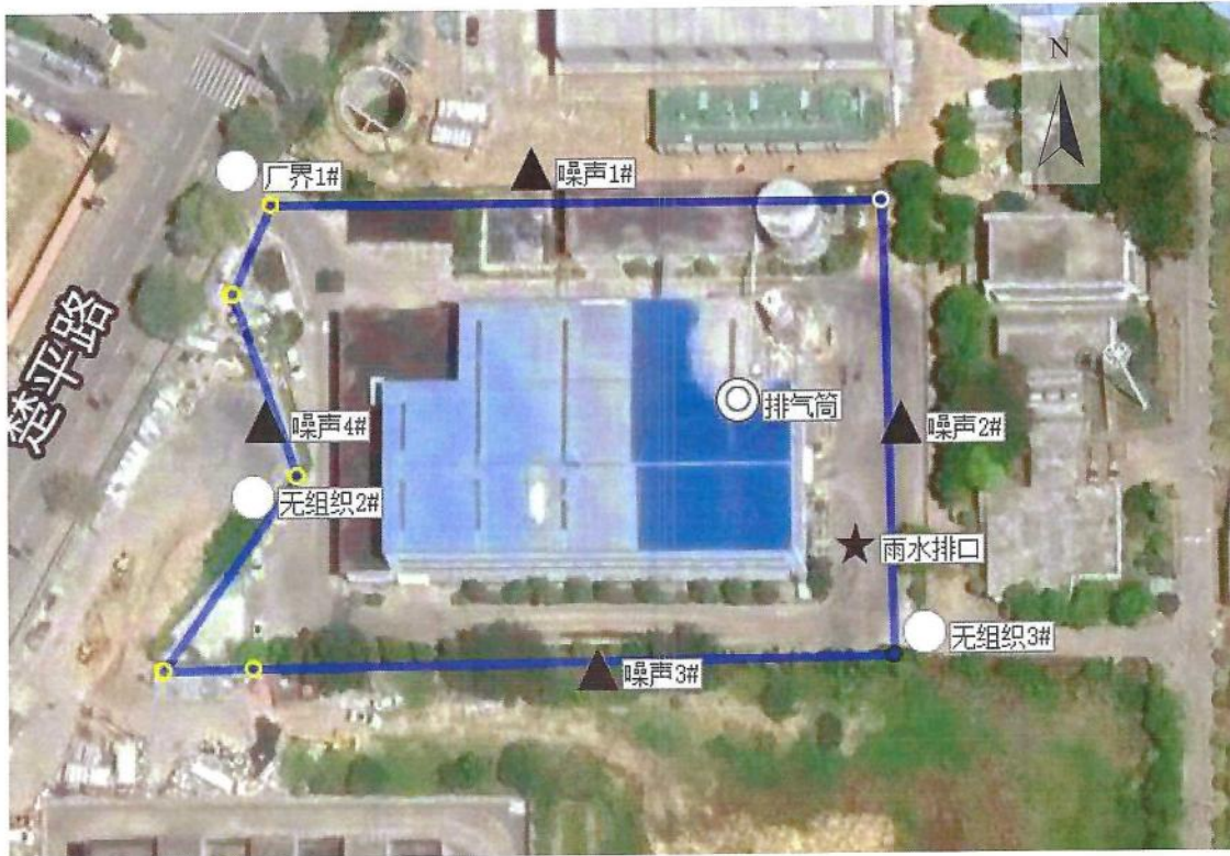
附图 1：监测点位示意图

图例： ◎有组织排放废气监测点位 ○无组织排放废气监测点位 ▲噪声监测点位 ★废水监测点位