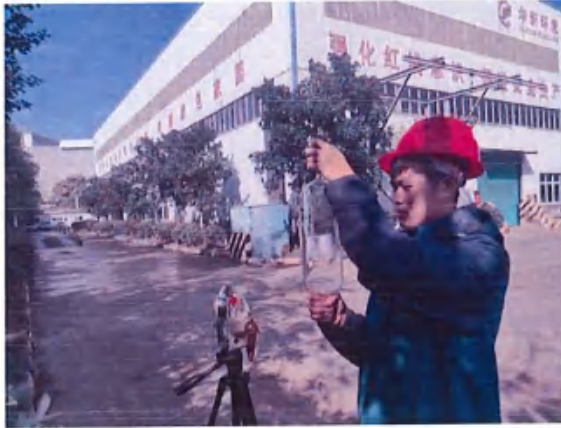
厂界 3#（O3）无组织排放废气监测点