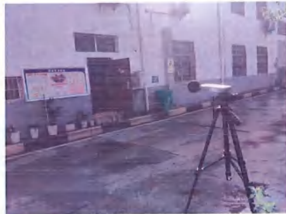
厂界 4# (▲4) 噪声监测