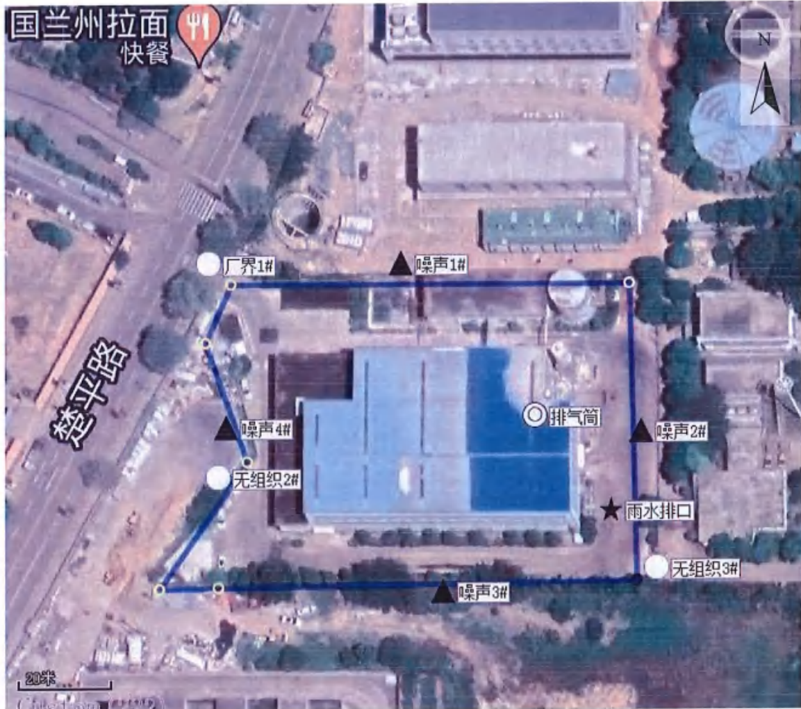
附图 1：监测点位示意图

图 例 ○ 无组织排放废气监测点位 ◎ 有组织排放废气监测点位 ▲ 噪声监测点位 ★ 废水监测点位