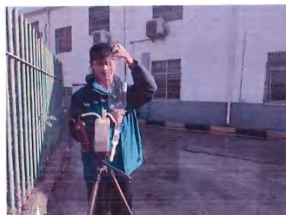
厂界 2# (O2) 无组织排放废气监测点