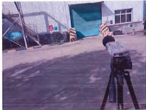
厂界 2# (▲2) 噪声监测