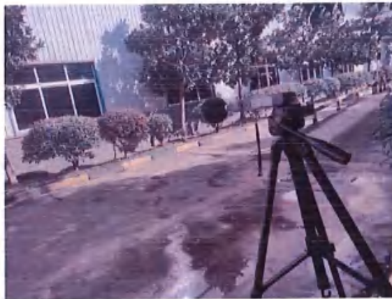
厂界 3# (▲3) 噪声监测