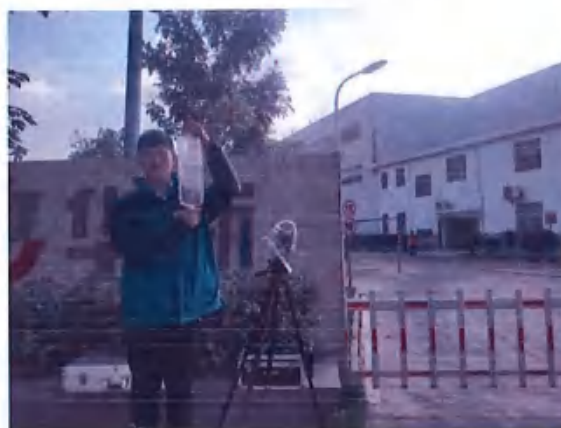
厂界 1# (O1) 无组织排放废气监测点