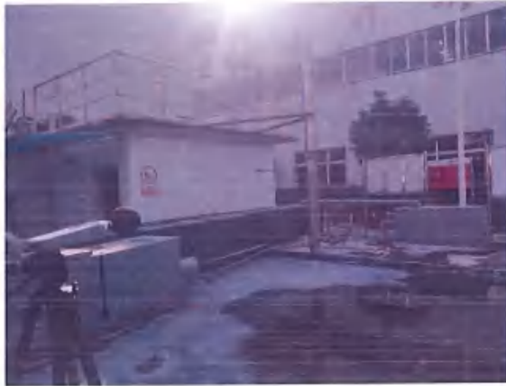
厂界 1# (▲1) 噪声监测