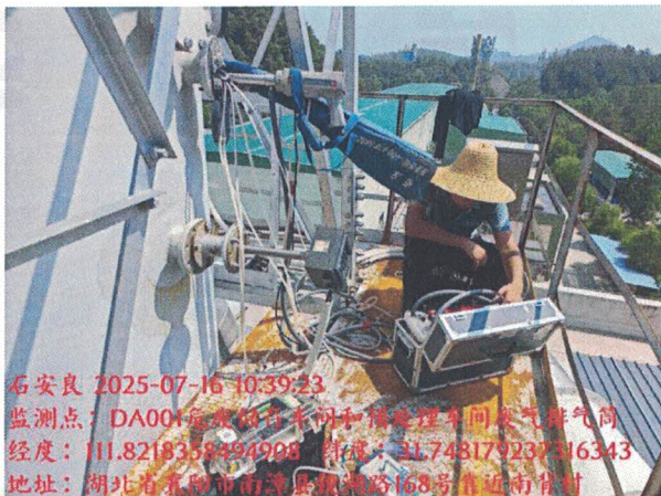
DA001 危废储存车间和预处理车间废气排气筒