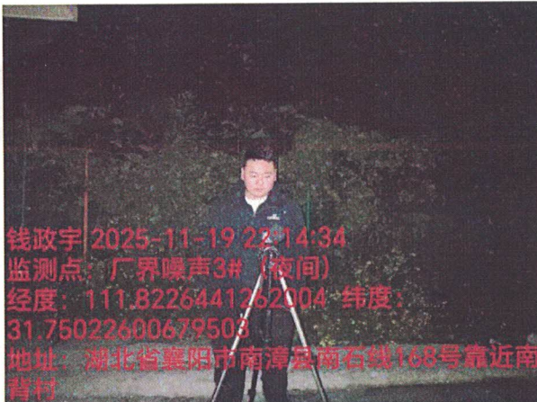
厂界噪声 3# (夜间)