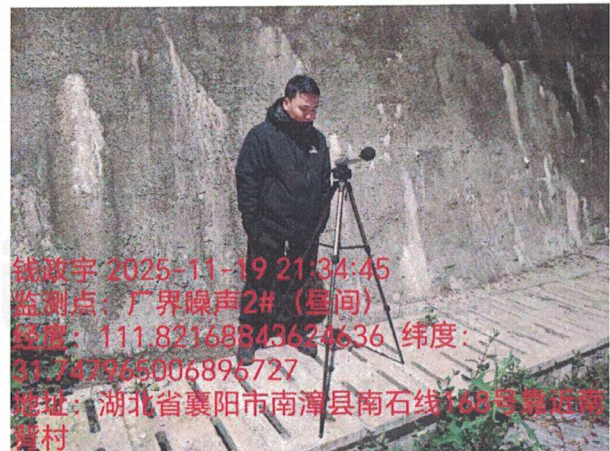
厂界噪声 2# (昼间)