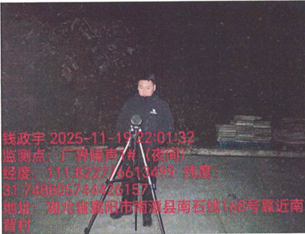
厂界噪声 1# (夜间)