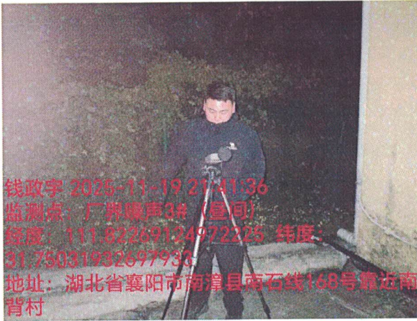
厂界噪声 3# (昼间)