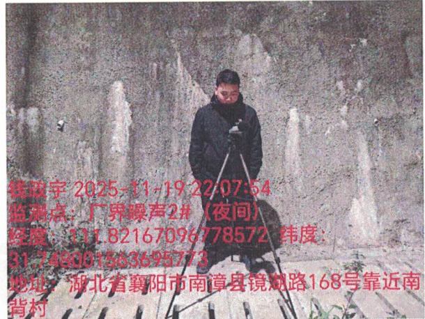
厂界噪声 2# (夜间)