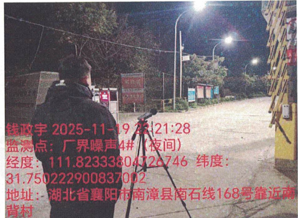
厂界噪声 4# (夜间)