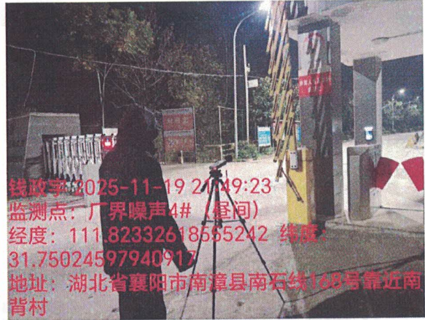
厂界噪声 4# (昼间)